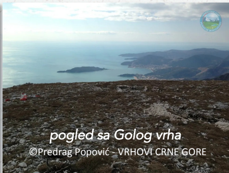
pogled sa Golog vrha