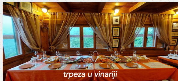
trpeza u vinariji

Planiran je obilazak zanimljivog izletišta i nekoliko vinarija u regiji Crmnice. Posetićemo mesto gde je prema predanju, sahranjen crnogorski car Šćepan Mali. Organizovaćemo zajednički ručak u jednoj od vinarija u Crmnici ili na predivnoj terasi obližnjeg paštrovskog sela. Ko ne bude zainteresovan za vinarije i ručak, može samostalno planirati dan.